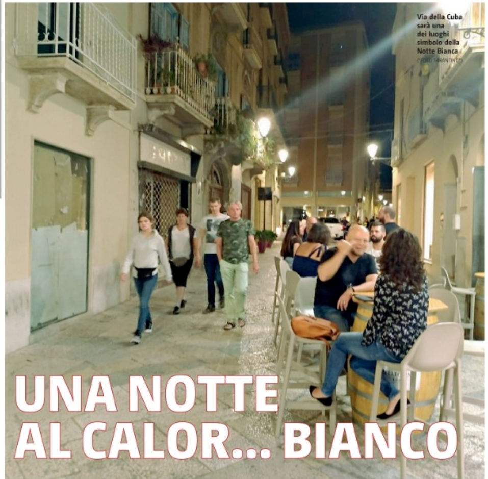
Via della Cuba sarà una dei luoghi simbolo della Notte Bianca