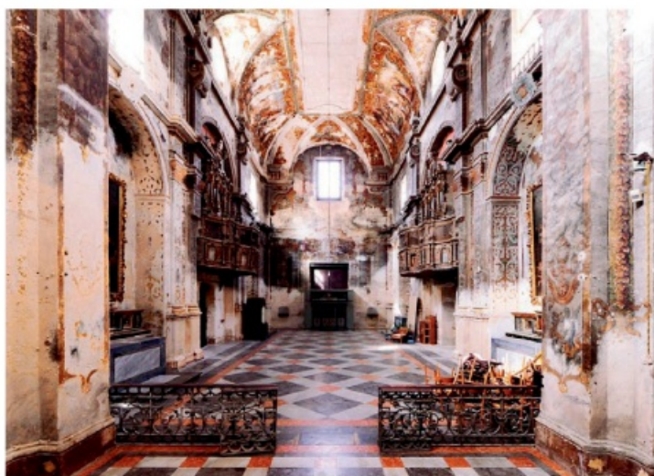
Di particolare pregio il portale settecentesco in marmo grigio e pietra tufacea

assolvono più alle loro originarie funzioni. Sarà rifatto l'impianto elettrico secondo la vigente normativa Cee e saranno effettuati gli interventi necessari a rendere fruibile la chiesa e i locali annessi da parte dei disabili. Il recupero della Chiesa di San Giuseppe sarà effettuato con il consolidamento della struttura che dovrà essere agibile anche con la cucitura delle volte; il restauro degli intonaci della Chiesa e rifare quelli dei locali annessi in cui, per altro, verrà anche rifatto il pavimento; la collocazione di un ascensore vista la futura utilizzazione di parte del bene ecclesastico; la pulizia e la sistemazione dei dipinti di notevole pregio e valore che sono all'interno della Chiesa; il rifacimento degli impianti tecnici e le finestre dei locali annessi e l'abbattimento delle barriere architettoniche, il tutto con l'utilizzo di materiali eocompatibili. La Chiesa di San Giuseppe, edifi-